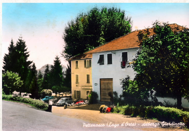
Pettenasco (Lago d'Orta) - Albergo Giardinetto