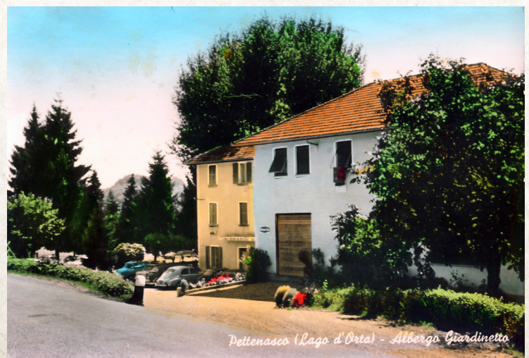
Pettinasco (Lago d'Orta) - Albergo Giardinetto